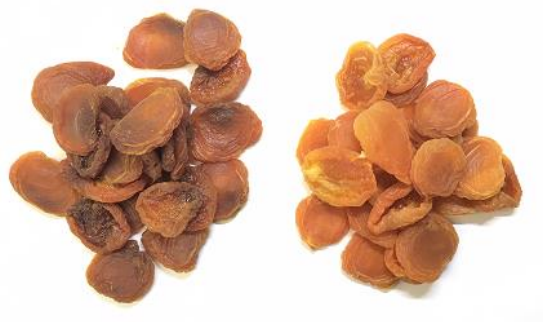
画像3：経時変化による退色（酸化）