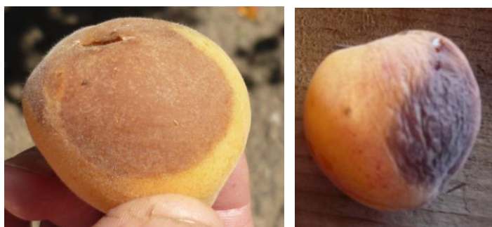
画像1：日焼けをした生鮮果実